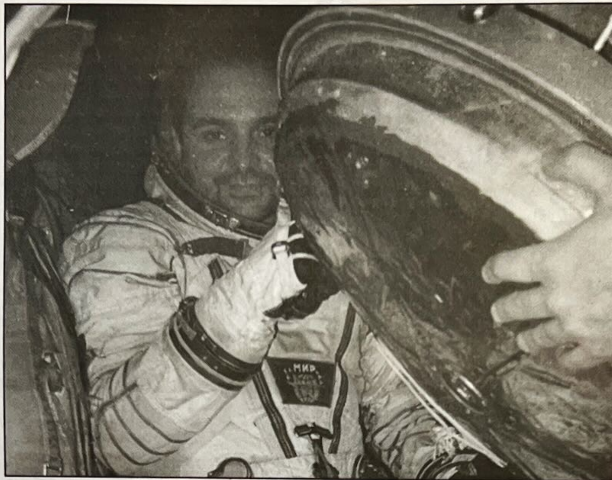
Holiday Tours, una empresa dedicada al "turismo espacial"

En un principio, Holiday Tours también realizó negociaciones con Zeghram Voyages, otra firma norteamericana especializada en turismo exótico que en noviembre de 1999 vendió su división de viajes al espacio a Space Adventures, convirtiéndose esta última en la empresa